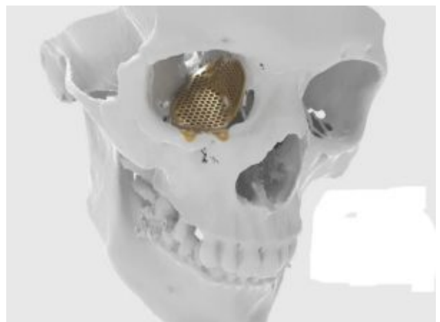
Implant maxillofacial personnalisé (source 3D Precision).

Parmi les projets menés par 3D Precision dans le domaine médical figurent une cage intersomatique avec structure lattice permettant une meilleure ostéo-intégration (conception et simulation), et divers implants personnalisés, notamment dans le domaine de la traumatologie : implants crâniens, faciaux et de la main. La fabrication additive présente ici l'avantage de prodiguer plus de confort au patient (l'implant étant exactement adapté à sa morphologie), d'augmenter les chances de succès de l'intervention chirurgicale (précision de l'implant), de réduire le temps opératoire, et de diminuer le délai de fabrication.